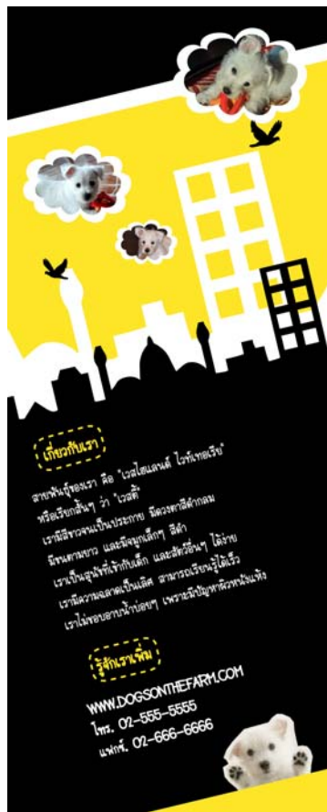
ภาพตัวอย่างประกอบ

ให้นำเสนอตัวเองด้วยการออกแบบชิ้นงาน 2 ชั้น ในส่วนของข้อความและภาพประกอบ โดยมีข้อกำหนด ดังนี้